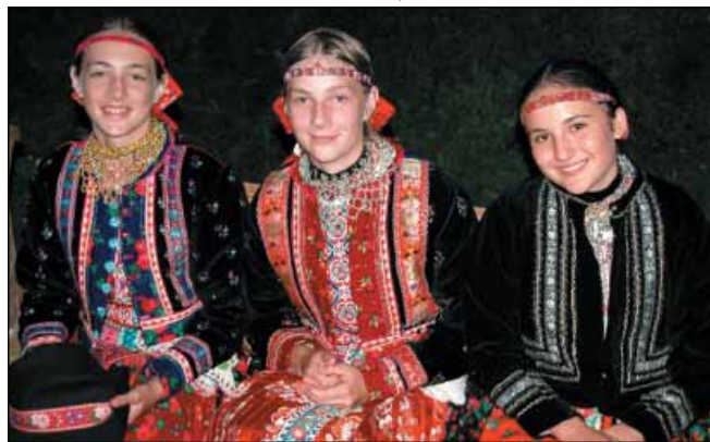
Dievčence z folklórnej skupiny z Dačovho Lomu